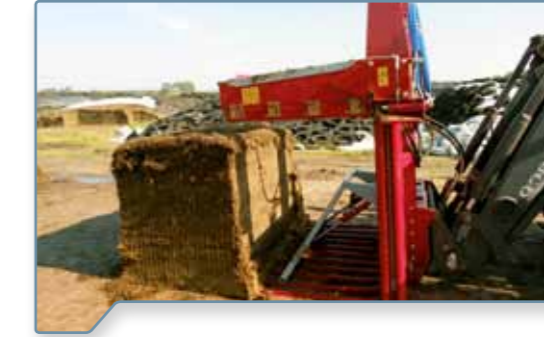
mit hydraulischem Abschieber