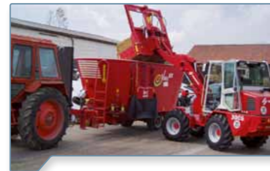
komfortables Beladen von Mischwagen