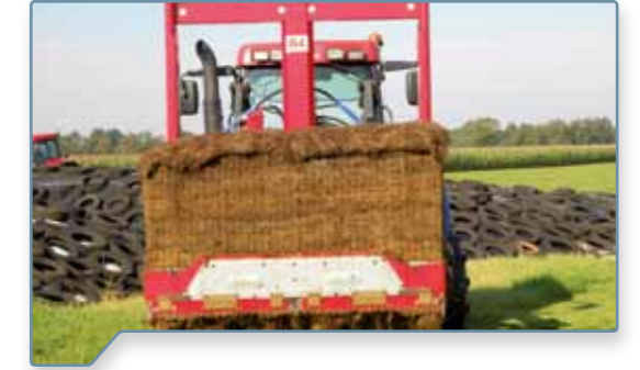
zuverlässig in Gras- und Maissilage