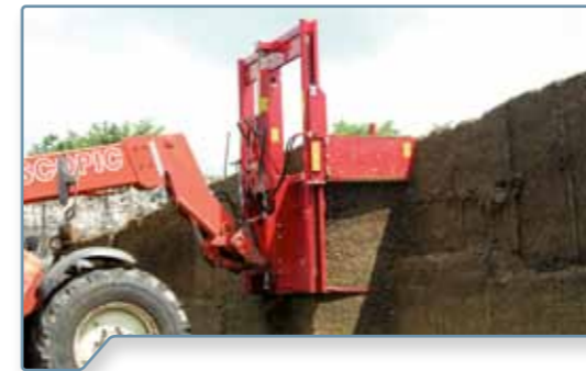
Frontanbau an unterschiedliche Trägerfahrzeuge möglich