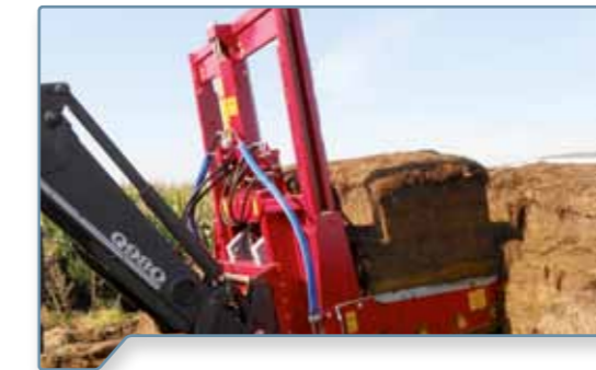
Blöcke von bis zu 3,65 m 3