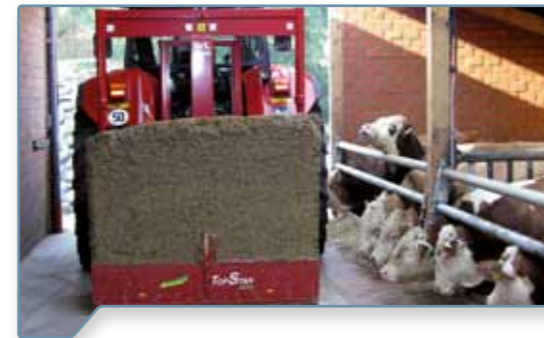
Anbau im Heck

Alle Antriebs Elemente sind im schmalen Schneidbügel eingekapselt und kommen nicht mit Silage in Verbindung. Bei anspruchsvollen Arbeitseinsätzen sorgen die stabile Rahmenkonstruktion sowie die Buchsenlagerung der Gabelzinken für eine hohe Lebensdauer. Der mittig positionierte Vorschubzylinder garantiert zudem einen geraden Schnitt und eine gleichmäßige Belastung der Zugseile.