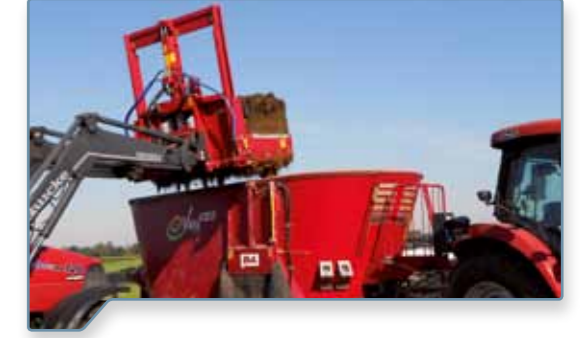
ideal für Profi-Betriebe