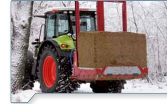
robust unter härtesten Bedingungen