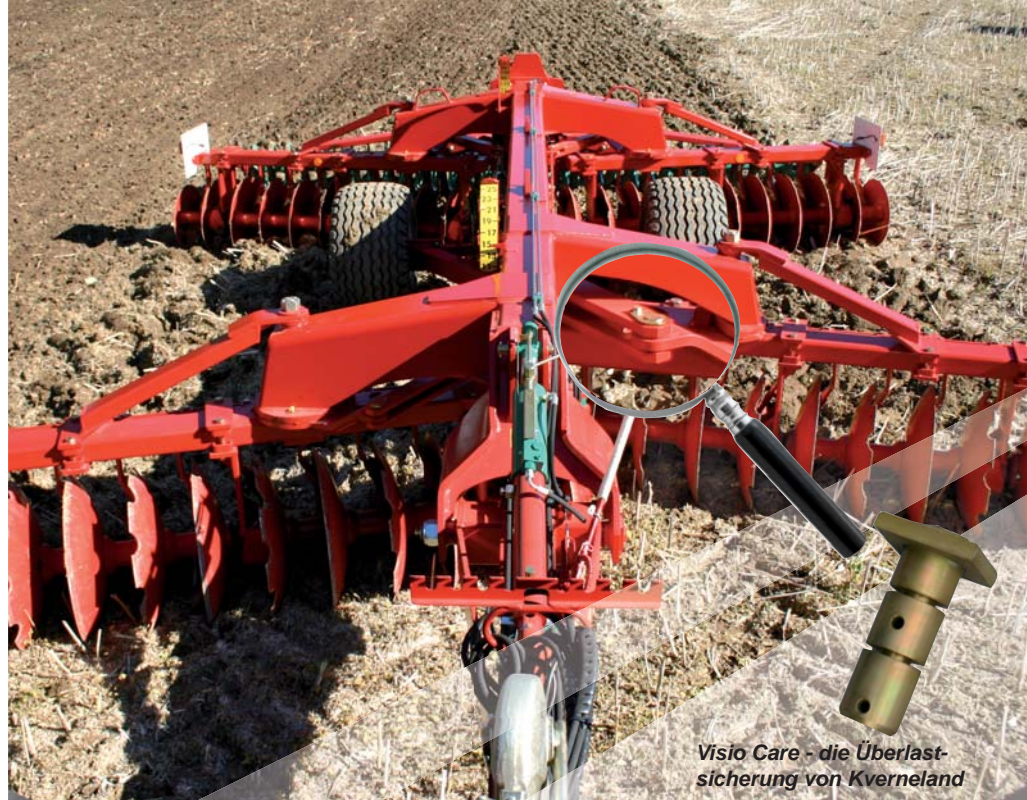
Visio Care - die Überlastsicherung von Kverneland

Ein weiteres doppeltwirkendes Steuergerät wird zur Bedienung des Parallelaushubs am Fahrwerk und der Deichsel verwendet. Die Arbeitstiefe