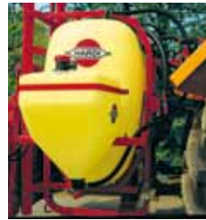
60 l Spülwasserbehälter*