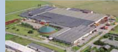
Nørre Alslev, Dänemark