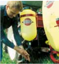
15 l Reinwasserbehälter*