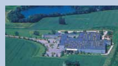
Høje Taastrup, Dänemark

EXEL Industries ist in drei Hauptbereichen der Applikationstechnik vertreten: Industrie (Lackierausrüstungen), Gartenbauspritzern und Golfplatzgeräten, sowie in der Landwirtschaft (Feld-, Obst- und Weinbauspritzern).