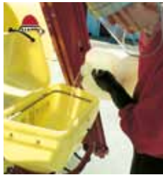
25 l Einspülschleuse