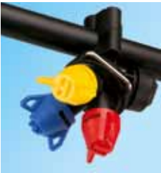
TRIPLET 3-fach Düsenhalter *Serie in D und A